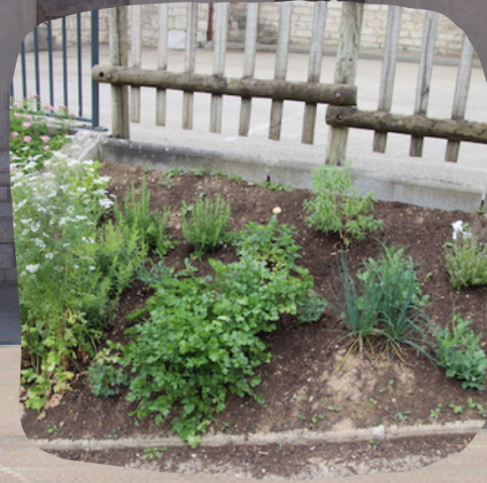
PAT Projet Alimentaire Territorial