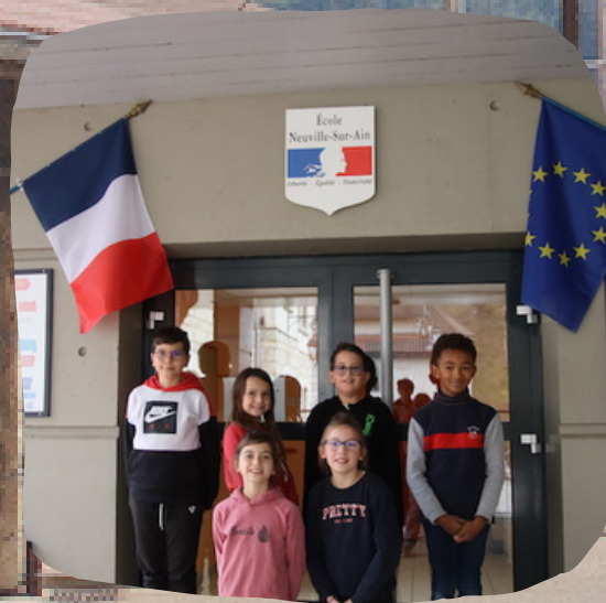
Élection du conseil municipal des enfants