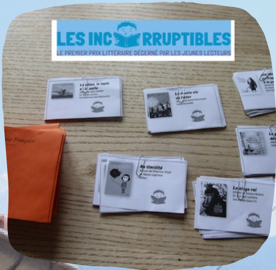
Les incorruptibles prix littéraire jeunes