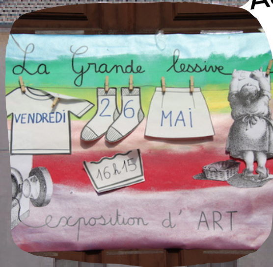
La grande lessive production de travaux d'élèves