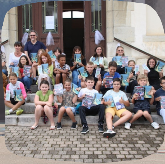
Remise prix CM2