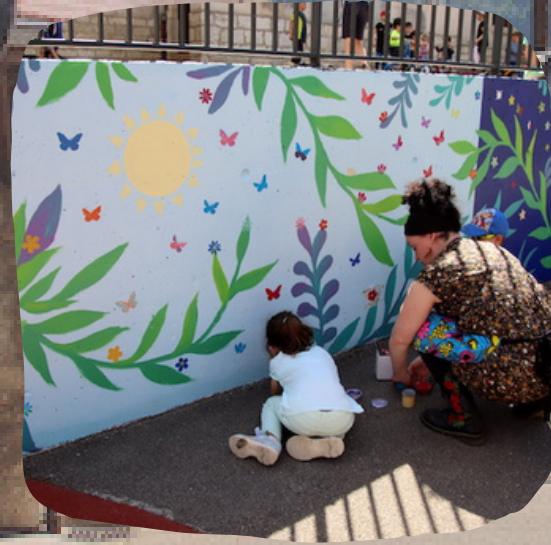
Participation à la création de fresque