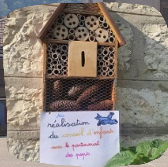
Réalisation du conseil d'enfants