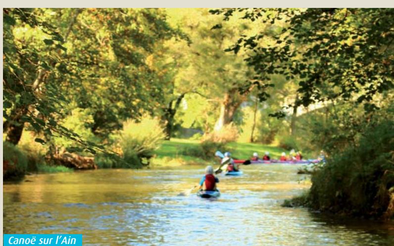
Canoe sur l'Ain

Neuville-sur-Ain s'est développée autour de deux rivières : l'Ain et le Suran.