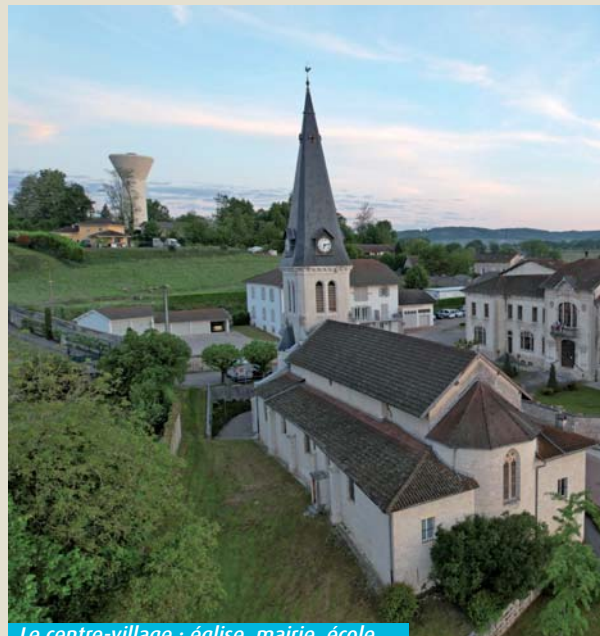
Le centre-village : église, mairie, école...