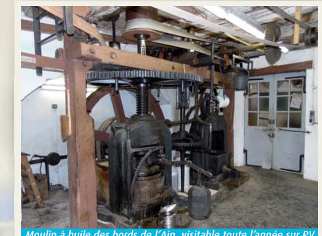
Moulin à huile des bords de l'Ain, visitable toute l'année sur RV

CONTACTER LA MAIRIE Par mail : mairie@neuvillesurain.fr Mairie principale : 04 74 37 77 16 Mairie annexe : 04 74 35 18 35 Par courrier postal : Mairie principale Place Michel Floriot - 01160 Neuville-sur-Ain