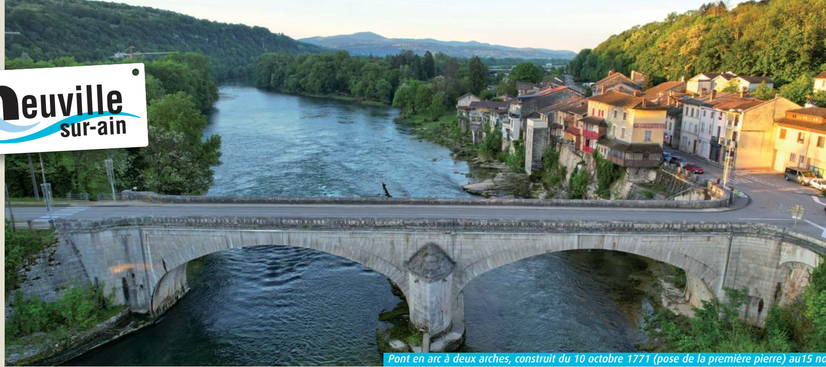
Pont en arc à deux arches, construit du 10 octobre 1771 (pose de la première pierre) au 15 novembre 1777 (réception officielle des travaux)