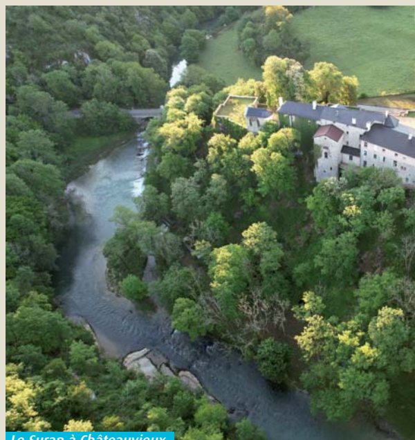
Le Suran à Châteaueux