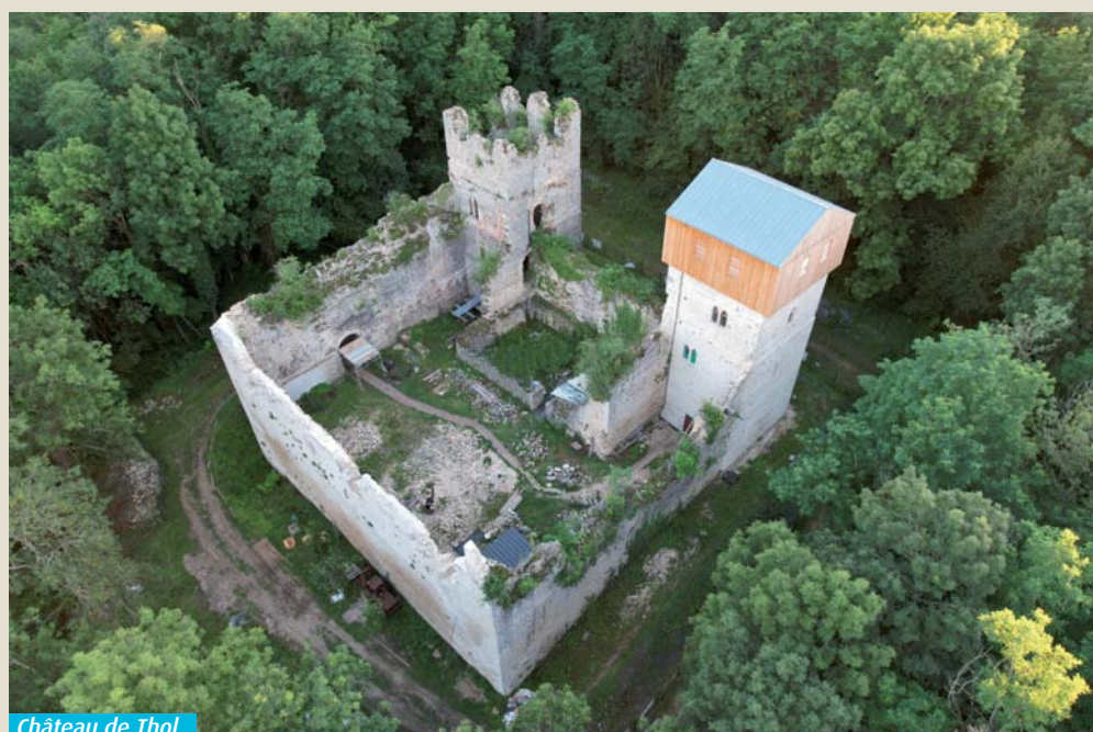
Château de Thol