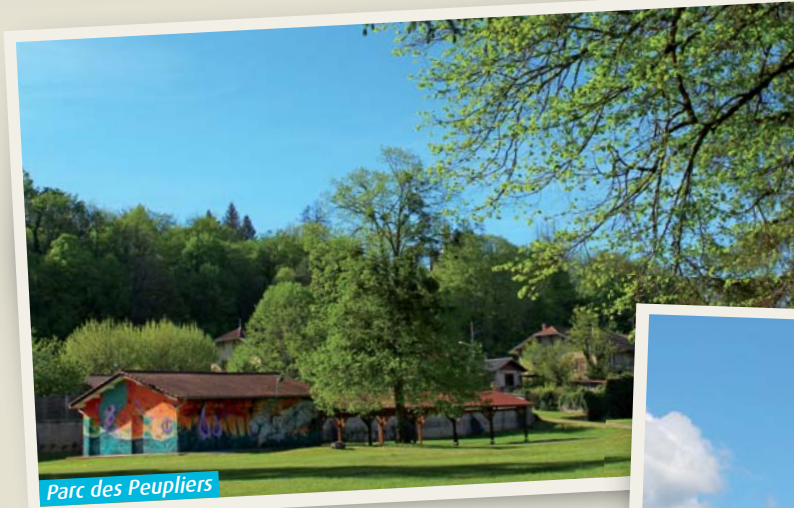
Parc des Peupliers