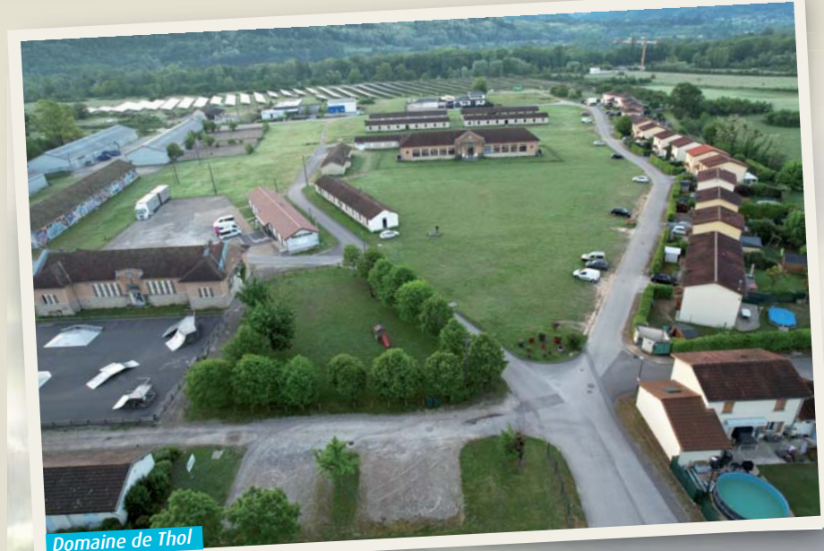
Domaine de Thol