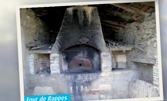
Four de Rappes