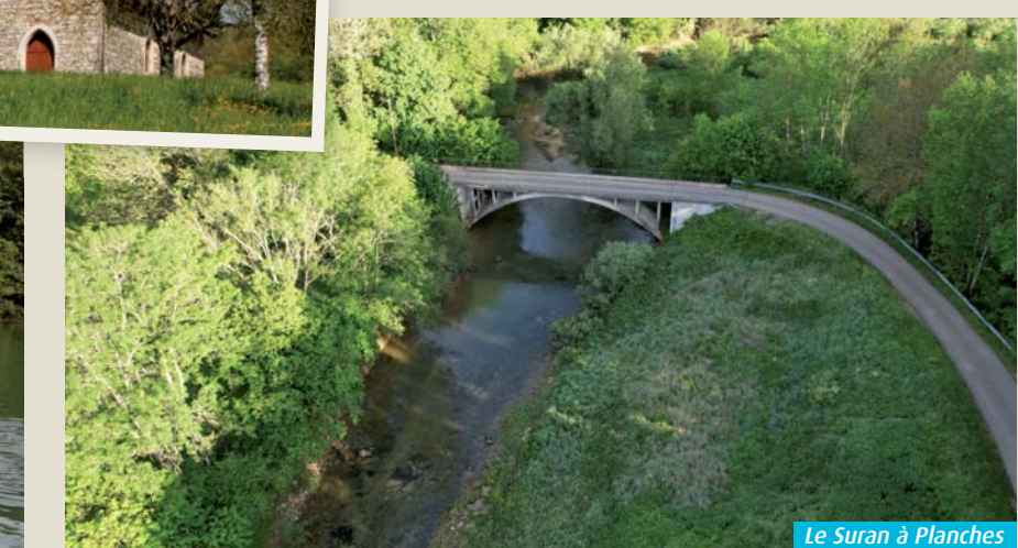
Le Suran à Planches