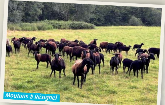
Moutons à Résigné