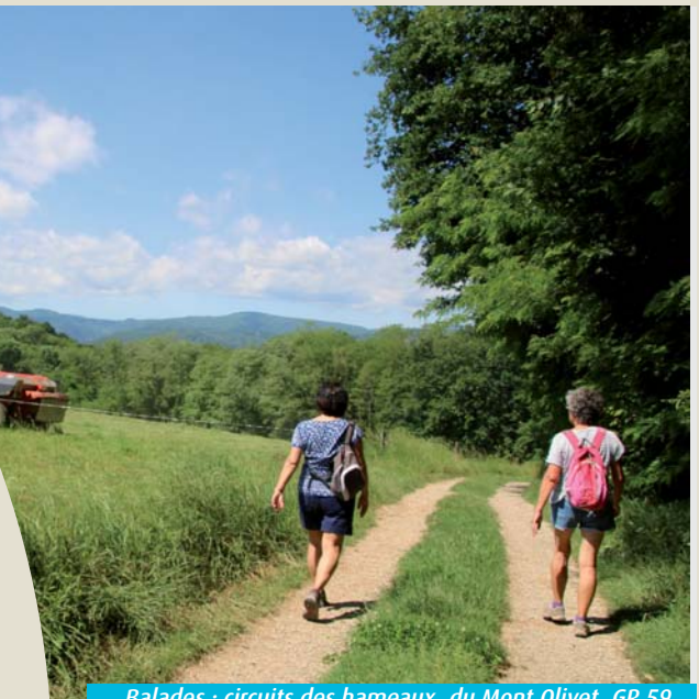
Balades : circuits des hameaux, du Mont Olivet, GR 59...