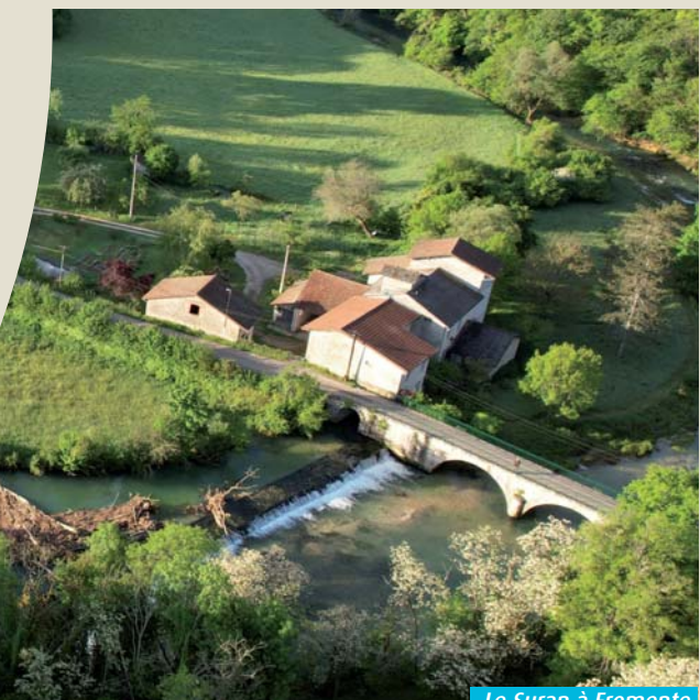
Le Suran à Fromente